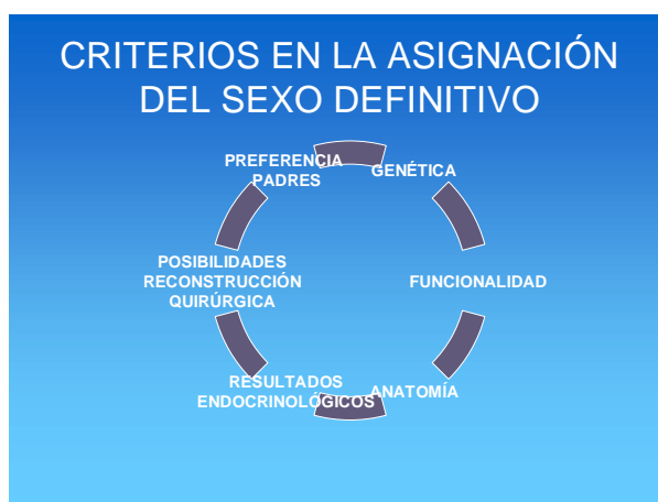
IMAGEN 1. Esquema con los criterios en la asignación de sexo definitivo en bebés intersexo (Elaboración propia).

A pesar de que en la actualidad los protocolos que John Money desarrolló son duramente criticados por el estamento médico, comprobaremos que paradójicamente, los discursos y protocolos actuales en España para situaciones intersexuales no se alejan tanto de sus orígenes. A día de hoy, los protocolos que se siguen en España para decidir el sexo definitivo que se asignará a un recién nacido intersexual responden, en mayor o menor grado 4 , a diferentes criterios: se considera la anatomía de los genitales externos, el cariotipo, el tipo de gónadas que presente –esto marcaría la capacidad reproductora futura-, los resultados endocrinológicos o respuesta hormonal, la capacidad funcional, las posibilidades de reconstrucción quirúrgica y la decisión o expectativas de los padres; aunque en última instancia, el propio criterio del profesional médico que está a cargo de esa persona, y dependiendo de la experiencia que tenga en situaciones similares, inclinará la balanza hacia lo "femenino" o hacia lo "masculino".