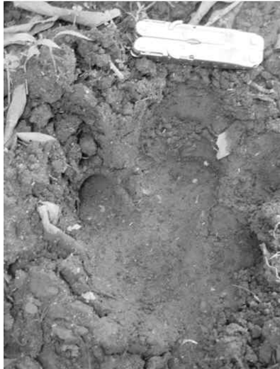
Figura 3 Fotografía del registro de huella del tapir centroamericano en el área de estudio.