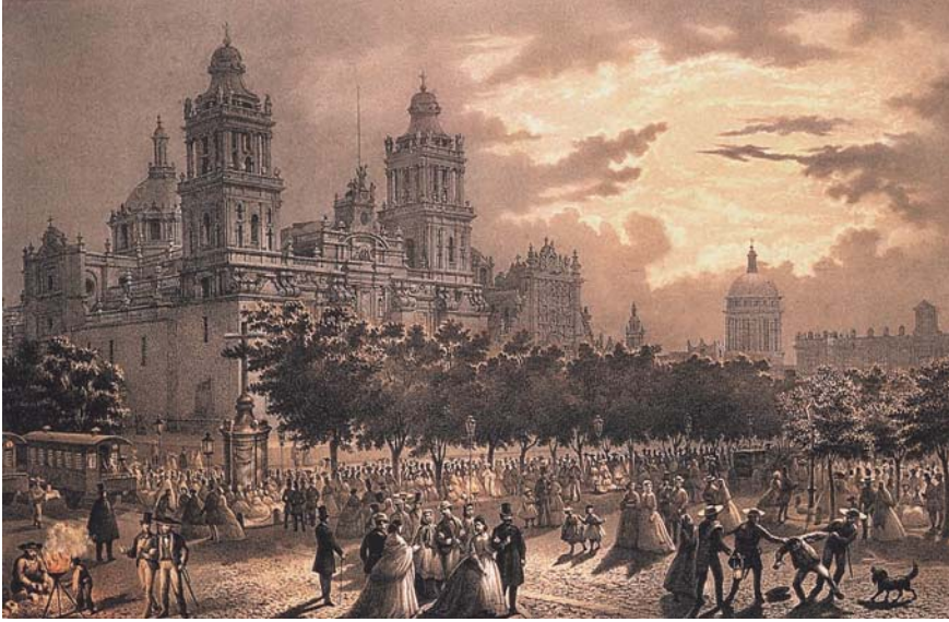
3. Casimiro Castro, El Paseo de las Cadenas en noche de luna , 1855, tomada de Carlos Monsiváis et al. , Casimiro Castro y su taller , México, Instituto Mexiquense de Cultura/Fomento Cultural Banamex, 1996, p. 134.