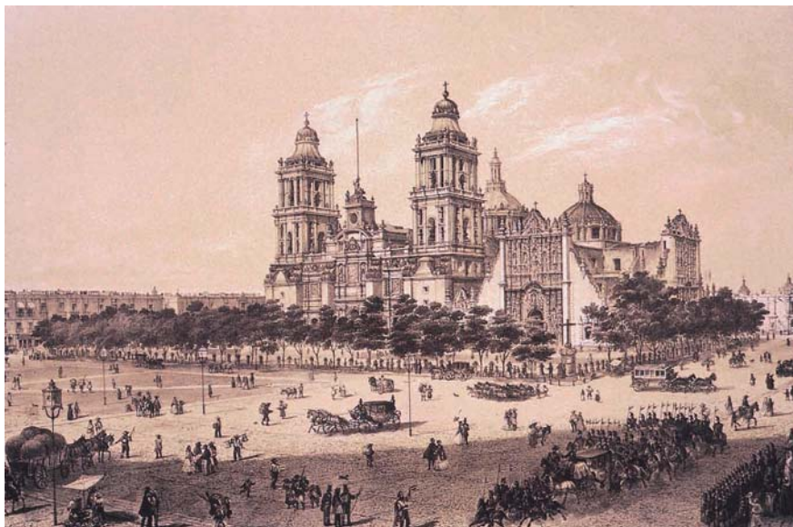
4. Casimiro Castro, La Catedral de México , tomada de Carlos Monsiváis et al., Casimiro Castro y su taller , México, Instituto Mexiquense de Cultura/Fomento Cultural Banamex, 1996, p. 146.

Esta ciudad, declarada en 1824 como capital federal, sede de los poderes federales, se había convertido en el teatro donde se realizaban motines, desfiles de triunfadores, cambios de mando y celebraciones de triunfo. Era el escenario a donde llegaban y en donde terminaban los levantamientos y las asonadas. Era el centro nuclear de las diferentes actividades y por lo tanto se había convertido en un codiciado botín político. Pero además, era una ciudad de contraste.