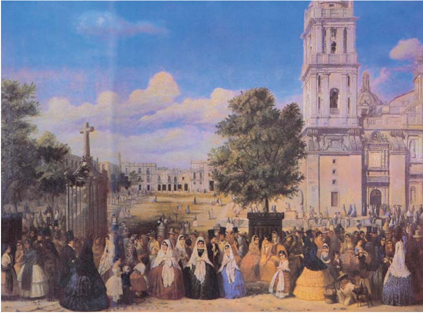
2. J.S. Hegi, La Catedral y el Paseo de las Cadenas el Jueves Santo, 1854 , tomada de Mario de la Torre (ed.), Hegi. La vida en la Ciudad de México , México, Banereser, 1989, p. 7.

Dos hechos contribuyeron a que el Paseo de las Cadenas aumentara su preferencia en el gusto de los habitantes de la ciudad: el uso del alumbrado público y la existencia de cuerpos de vigilancia como la policía nocturna, ambos permitieron la utilización de los espacios urbanos como escenarios para la distracción y el aprovechamiento del tiempo libre. Así, se incrementó la asistencia a las tertulias, teatros, cafés, fondas, tabernas, etc.