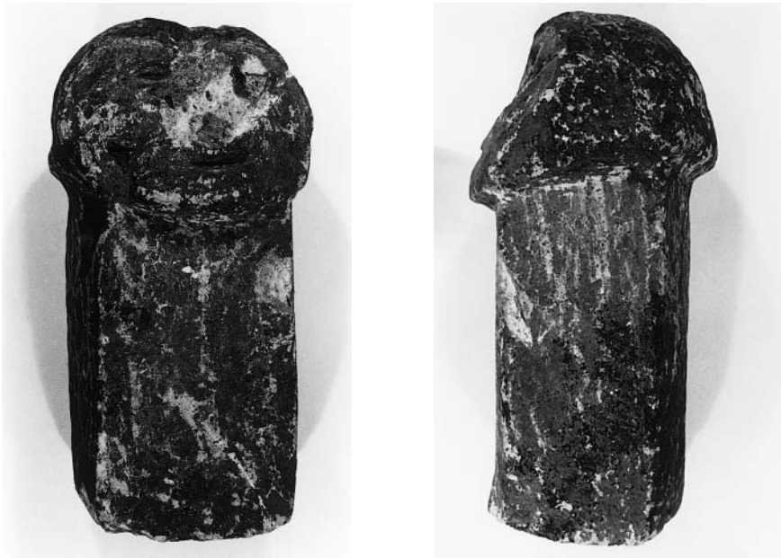
1 y 2. Escultura fállica chalchihuiteña encontrada en el marco del proyecto Hervideros de la unam.