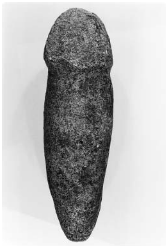
3. Escultura de Molino, vista frontal.