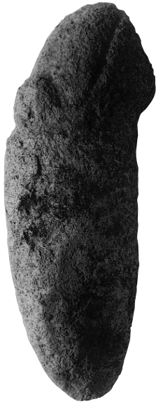
4. Escultura de Molino, vista de perfil.

reconocer, en el objeto que el falo carga, la representación en relieve de una vulva, impresión esta última que se refuerza con el contexto de objetos asociados a esta escultura. Al respecto se informa que “Entre las numerosas esculturas fálicas dispersas en la superficie de ese extenso sitio, otras más, fragmentadas, presentan lo mismo: un pene mecapanero cargando una vulva”. 27