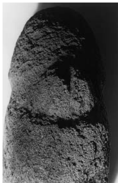
5. Escultura de Molino, detalle.

etnógrafo se ve enfrentado. Asimismo, la hipótesis de la herencia común entre los indios pueblo y las sociedades indígenas de la Sierra Madre Occidental se vuelve cada vez más plausible debido a los nuevos descubrimientos en el terreno del arte rupestre y del repertorio iconográfico de la cerámica del Occidente de México y del gran Suroeste. 28