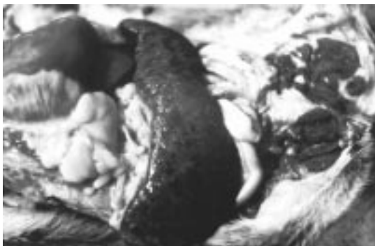
Figura 1 - Esplenomegalia oriunda da infiltração neoplásica em um cão com linfossarcoma multicêntrico.

anteriores e posteriores, caracterizando-se pelo aparecimento agudo de dispnéia, taquipnéia, tosse, regurgitação, anorexia, caquexia e letargia (BAUER, 1992). Os achados físicos incluem cianose, deslocamento dos ruídos cardíacos dorsocaudalmente, ausência de ruídos broncovesiculares e som maciço na percussão torácica (COUTO, 1992). Pode ainda ocorrer hemotórax com grande número de células linfóides vacuolizadas e quilotórax (FIGHERA, 2000).