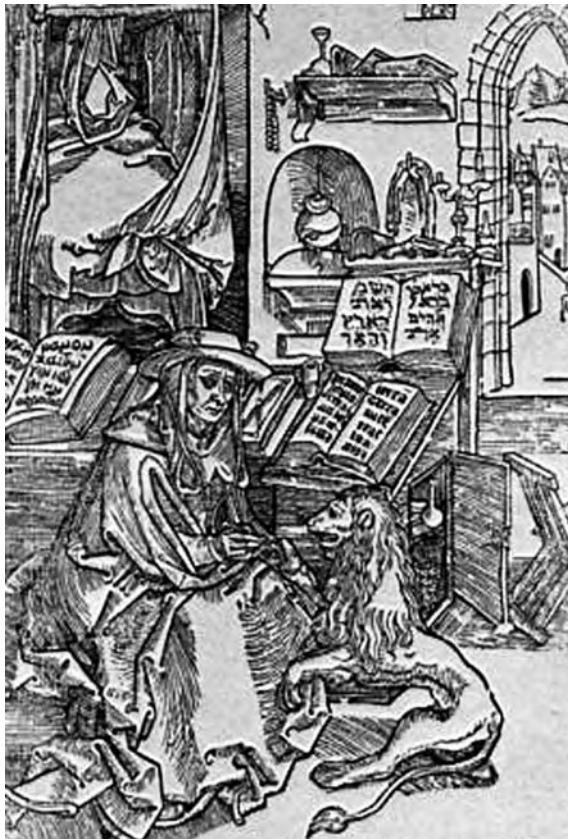
Durero. San Jerónimo

Para ello le sirvió el conocimiento del hebreo que había adquirido cuando se valió del arduo trabajo intelectual para someter las tentaciones de la carne que sufría en la soledad de las cuevas. Siempre se le representa entregado a la lectura y a la escritura; Durero hizo un grabado donde lo presenta junto a sus inseparables volúmenes sagrados, San Jerónimo es símbolo del estudio, de la reflexión y la concentración.