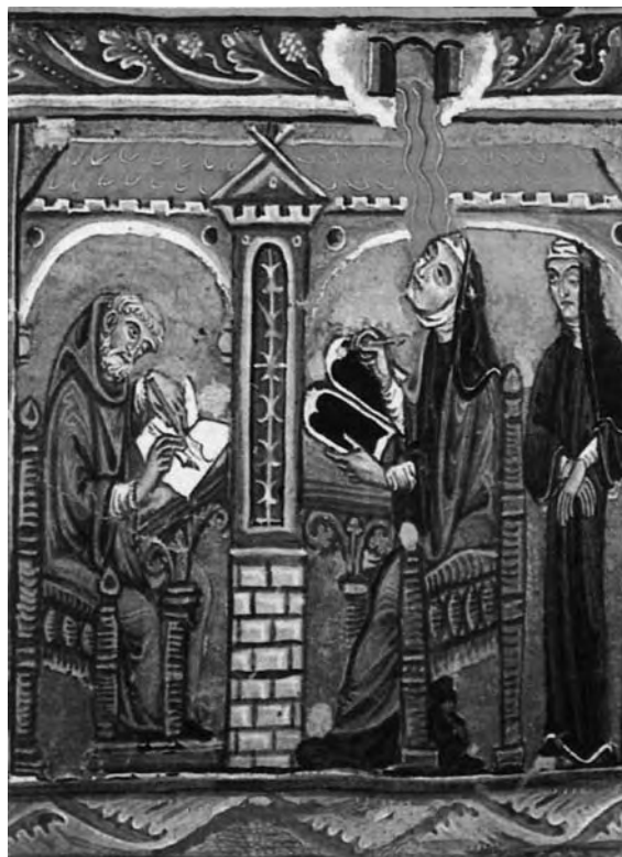
Hildegarda en éxtasis

Uno de los primeros y más famosos eremitas fue San Jerónimo (343-420), quien se encuentra entre los santos patronos de los bibliotecarios; es además uno de los cuatro Doctores de la Iglesia Latina. A él se debe la