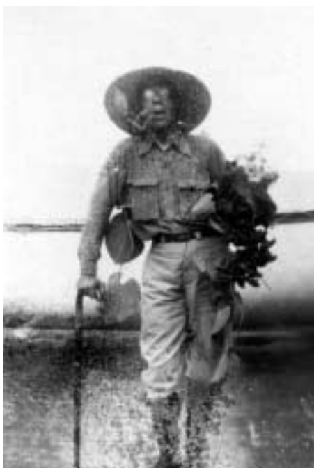
Figura 15 – “Eu voltando do passeio por Assacaio/ 17-VI-27/ Monstro à mostra” (notação no verso).