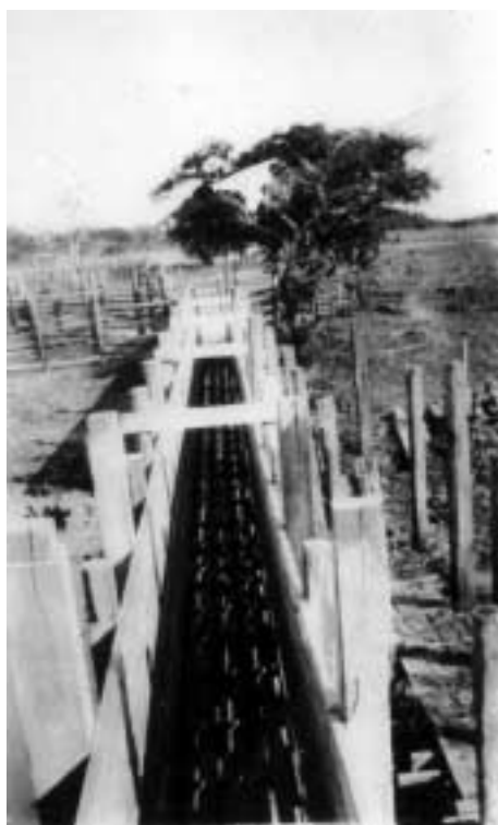
Figura 25 – “Caiçara pra embarque de gado/ S. Joaquim/ Marajó 29-VII-27/ diaf. 1, sol 1 das 16” (notação no verso).