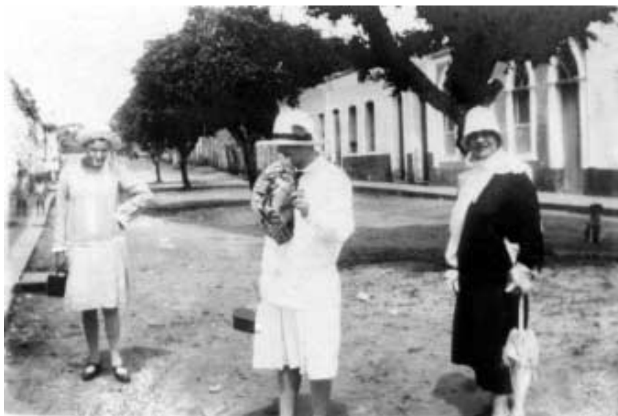
Figura 10 – “Coari – 11-VI-27/ Alto Solimões/ Manacá Trombeta e Balança” (notação no verso).