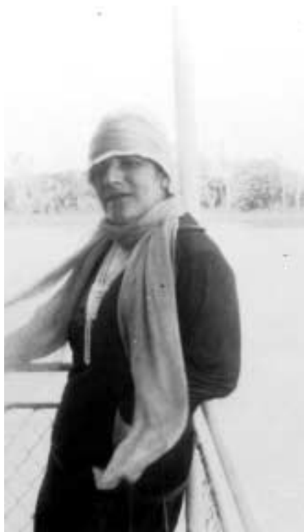
Figura 11 – “Nossa Senhora no Madeira/ 4-Julho-1927” (notação no verso).