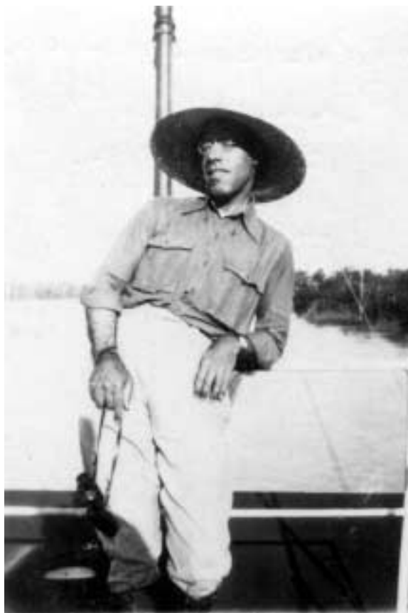
Figura 9 – “A bordo do S. Salvador em pleno Peru com Sol na cara/ 22-VI-27” (notação no verso).