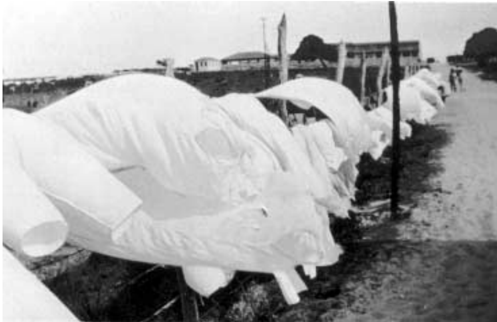
Figura 4 – “Roupas freudianas/Fortaleza, 5-VII-27/Fotografiarefoulenta/Refoulement/Sol I diaf. I”. Fotografia de Mário de Andrade. Acervo do Instituto de Estudos Brasileiros da Universidade de São Paulo.

sem dúvida, o dom de “compor o ambiente em que a realidade capitula diante da luz e se converte em uma expressão sugestiva e bela”, se fizermos nossas as palavras dele sobre a exposição Jorge de Castro, em 1939 21 . Curiosamente, essa foto recupera um varal rabiscado em 1923 (Figura 5), pelo leitor da L'Esprit Nouveau , na folha de guarda do seu exemplar do n. 10, de outubro de 1921 22 .