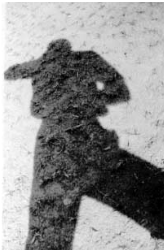
Figura 7 – Auto-retrato, 1927. Fotografia de Mário de Andrade. Acervo do Instituto de Estudos Brasileiros da Universidade de São Paulo.

De volta a seu meio, em 1º de janeiro de 1928, na fazenda de Tarsila, no interior paulista, a objetiva funde Mário de Andrade ao solo, entregue a esse seu artefazer. No contorno de um gigante que ganha o título camoniano “Sombra minha”, o gesto desvela a máquina-caixão. Renovadíssima forma do auto-retrato,