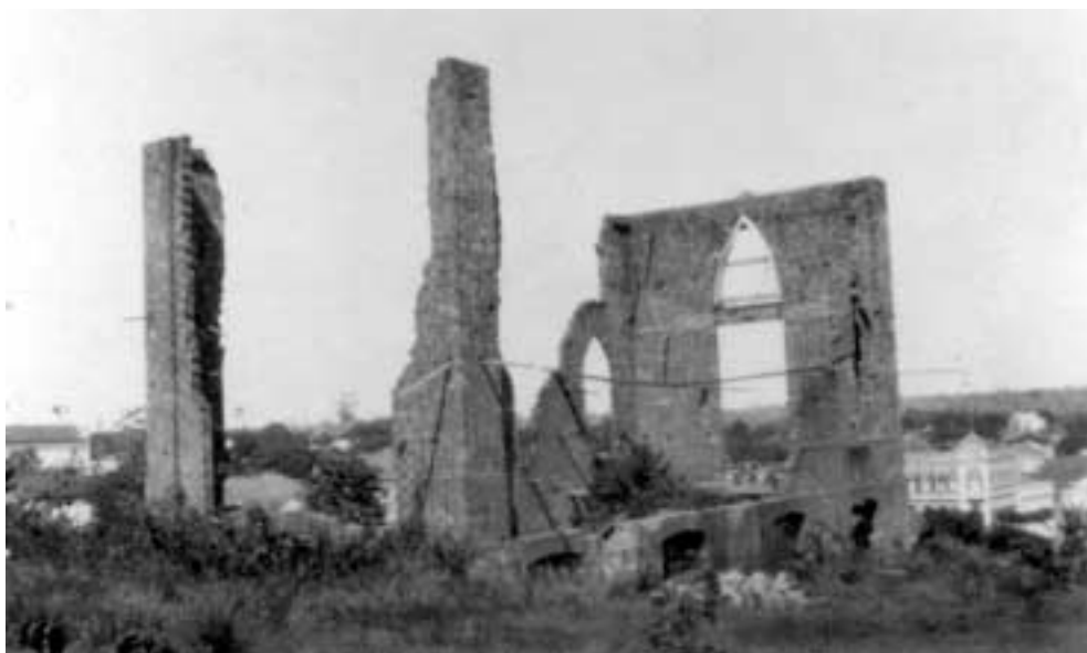
Figura 24 – “Única igreja de Porto-Velho/ 11-VI-27/ Sol 1 Diaf. 2 13 e 15/Nun arm Ich bin gehst du zuruck” (notação no verso).