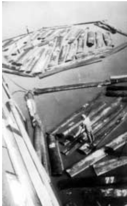
Figura 21 – “Jangadas de mogno enconstando no S. Salvador pra embarcar/Nanay 23- Junho 1927/ Peru/ Vitrolas futuras” (notação no verso).