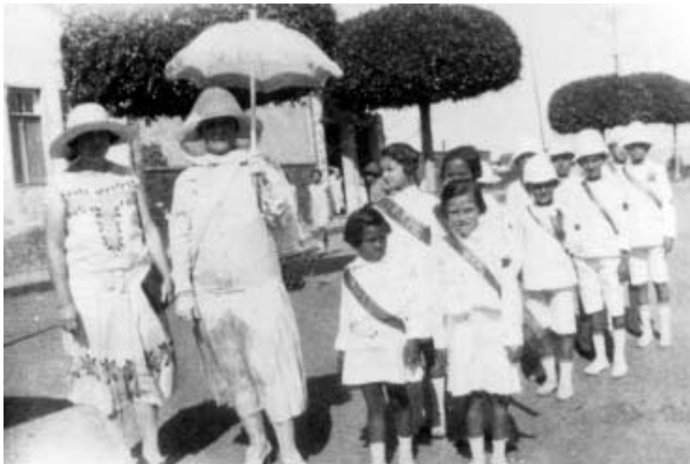
Figura 28 – "Procissão de Nossa Senhora em Porto-Velho/ 15-VII-27" (notação no verso).