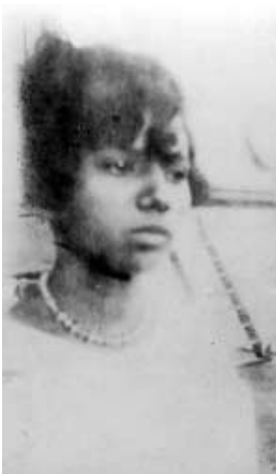
Figura 19 – “Boniteza tapuia/ De fato ela era mais bonita que o retrato. S. Salvador/ 1-VII-27/ ‘A Venus do milho!’” (notação no verso).