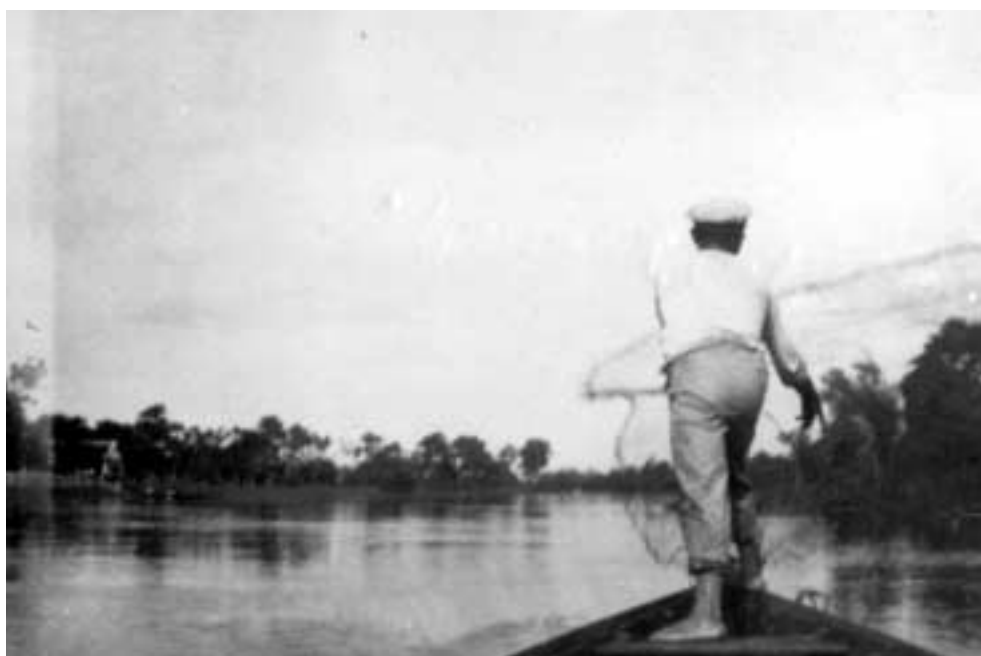
Figura 34 – “No furo de Barcarena (Manaus)/ Atirando a tarrafa 7-VI-27/ Tarrafeando” (notação no verso).