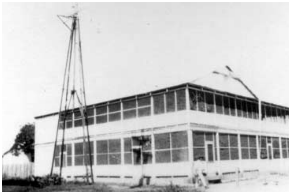
Figura 22 – “Casa telada da Madeira-Mamoré/ Porto Velho – 11-VI-27/ Obj. 2 Sol 1/ 13 e 10” (notação no verso).