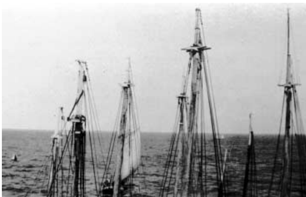
Figura 27 – “Veleiros encostados no Baependy/ Areia Branca/ 6-VIII-27/ Diaf. 3 – sol 1 das 7 e 40” (notação no verso).