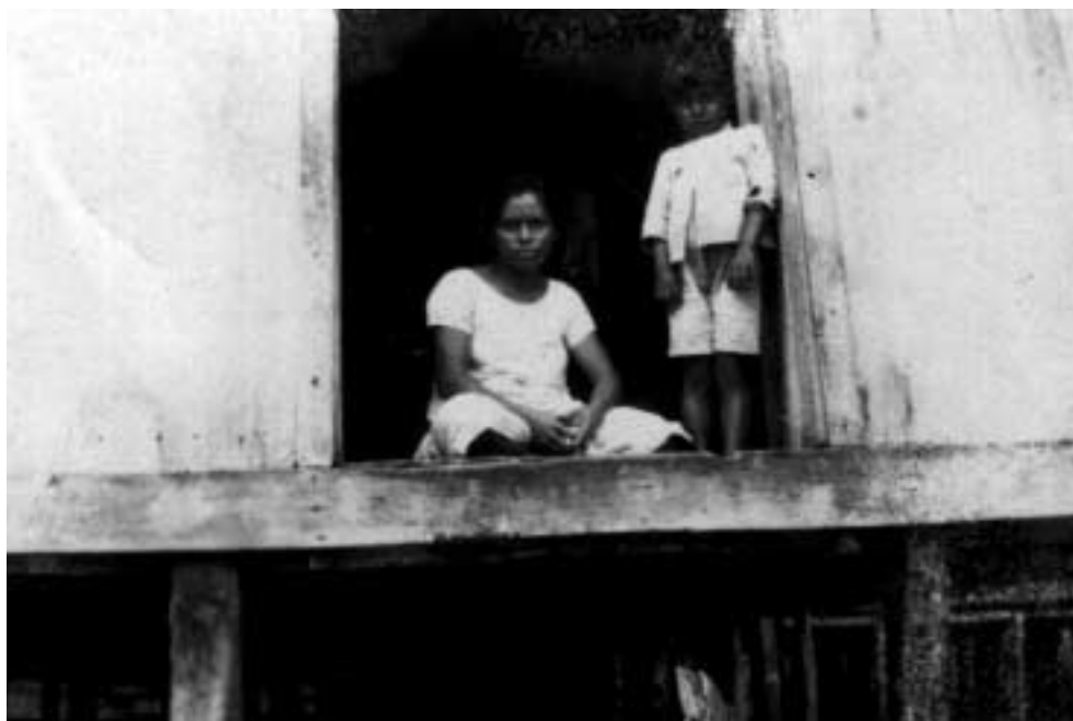
Figura 23 – “Margem do Solimões/ Junho – 1927/ Sobre as ondas” (notação no verso).