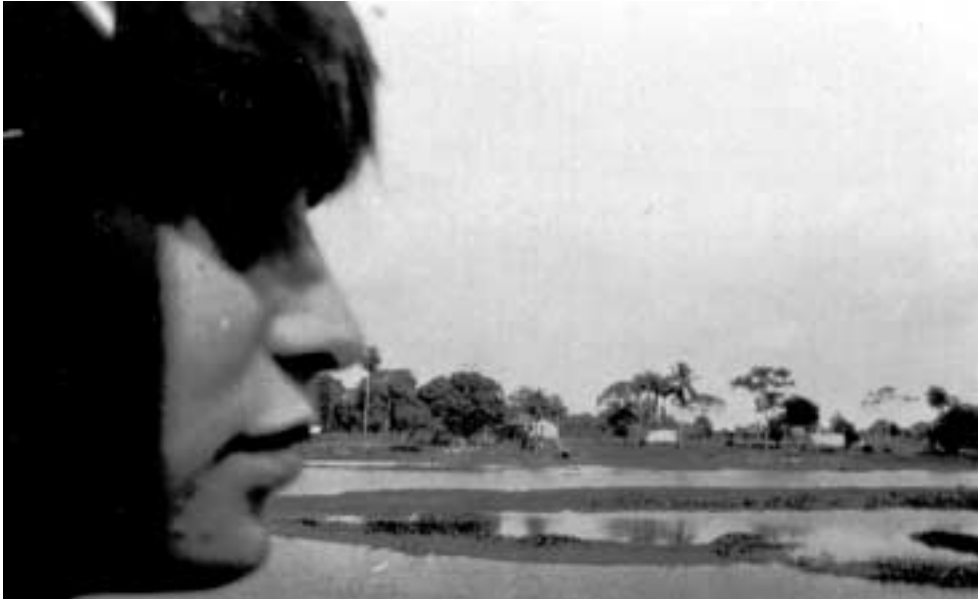
Figura 12 – “Dolur na vista marajoara 31-VII-27/ Sol 3 diaf. 3/ Trombeta” (notação no verso).