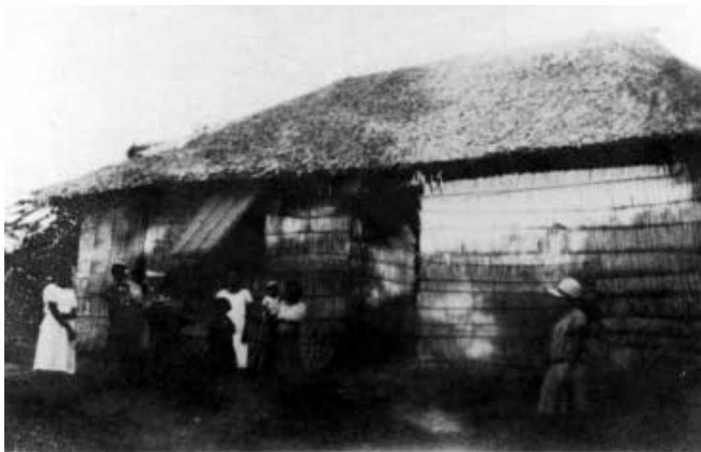
Figura 26 – “Caiçara/ rio Madeira/ 3-VII-27” (notação no verso).