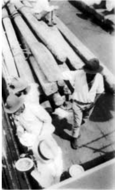
Figura 20 – “Almoço da 3ª. Classe. Baependy – ao largo/ 6-VIII-27/ diaf. 1 – Sol 1 das 10 Em terceira voracidade” (notação no verso).