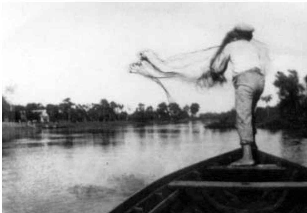
Figura 33 – “Atirando tarrafa/ Igarapé de Barcarena/ arredores de Manaus/ 7-VI-27” (notação no verso).