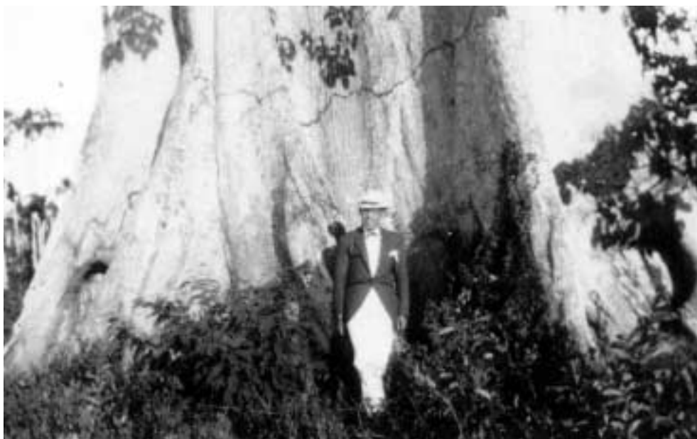
Figura 3 – “Eu diante dum tronco de sumaúma entre Sto. Antônio e Porto-Velho, nos limites entre Amazonas e Mato Grosso/11-VII-27/Diaf. 1 Sol 3/16 e 30”.

Outra vertente da mescla de fotos e legendas é aquela que retém – com engenho e arte – a função documental da fotografia ao se voltar para aspectos da geografia física da região, para o homem e a cultura material. Deste modo, a paisagem – a terra, os rios, a vegetação –, a população de brancos, mestiços e indígenas, homens, mulheres, curumins, os meios de transporte, trabalho, usos e costumes são fixados. A profusão de imagens, dentre as quais se pode lembrar o vaqueiro de Marajó, as caiçaras, isto é, os estrados que protegem os bois da voracidade das piranhas, o mogno cortado e numerado, deslizando na corrente, os sacos de sernambi, a pesca de tarrafa, a casa sobre palafitas, a casa de alvenaria telada, a maloca e os índios pintados com jenipapo, o hotel de janelas góticas, as ruínas da igreja de Porto Velho – para selecionar algumas –, recebe, nas legendas, além da identificação e do relatório técnico, o comentário cheio de humor, incluindo por vezes rimas, trocadilhos e a citação de versos de grandes poetas.