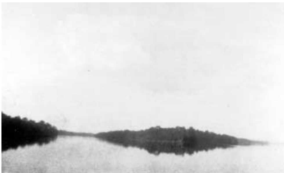
Figura 16 – “Entrada dum paranã ou paranã/ rio Madeira/ 5-VII-27/ Ilha de Manicoré. O I é o rio Maturá, o II é o Madeira” (notação no verso).