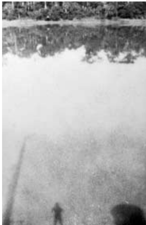
Figura 6 – Rio Madeira.