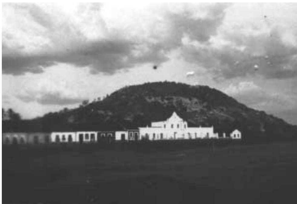
Figura 8 – Catolé do Rocha, 1929.

Em 1929, no término do primeiro tempo modernista dos grupos, dos programas e das polêmicas, o empenho do fotógrafo arrefece até cessar sem explicações. Mais tarde, como diretor do Departamento de Cultura da