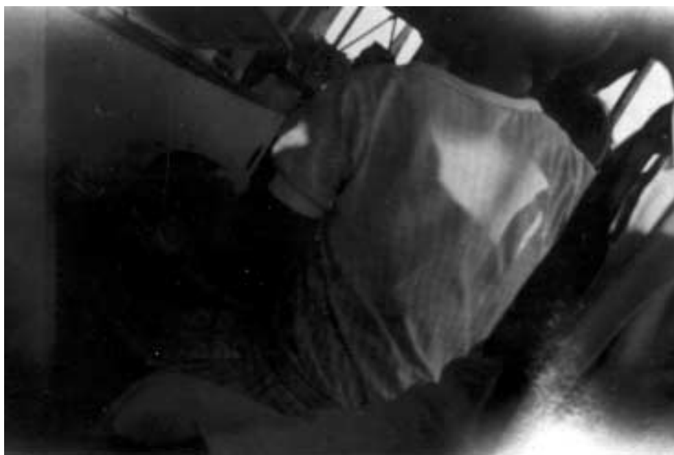
Figura 31 – “Desvairismo por acaso/ questão de lancha e de lunch/ 7-VI-27” (notação no verso).