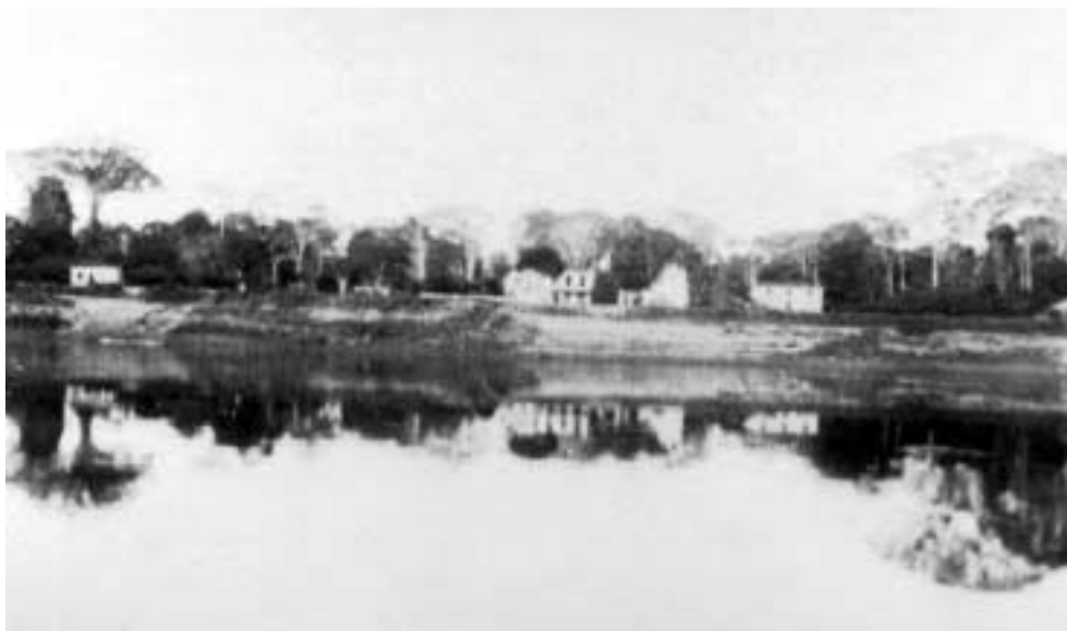
Figura 17 – “Bom-Futuro bonita/ O II é um igrejó gótico/ 6-VII-27/ rio Madeira/Ver as sumanúmas dos dois lados/ água de Narciso” (notação no verso).