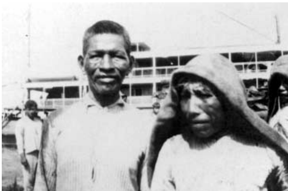
Figura 18 – “Assacaio/ 17-VI-27/ O mais alto é enegrecido pintado de genipapo” (notação no verso). Acervo do Instituto de Estudos Brasileiros da Universidade de São Paulo.