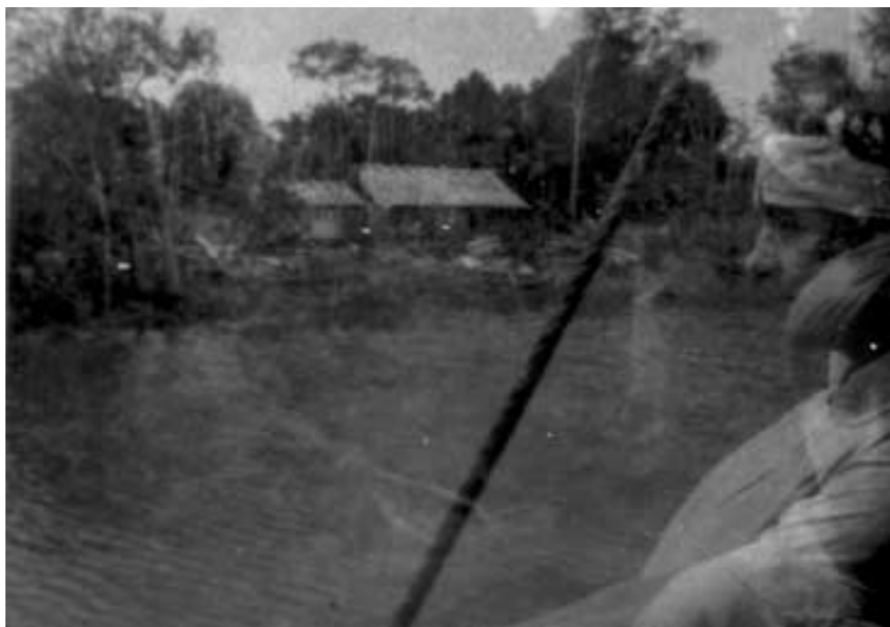
Figura 30 – “Foto futurista de Mag e Dolur sobrepostas às margens do Amazonas/ Junho 1927/ Obsessão” (notação no verso).