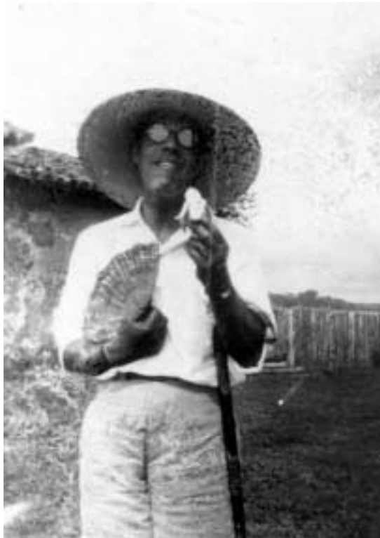
Figura 13 – “Aposta de Ridículo em Tefé/ 12-VI-27” (notação no verso).