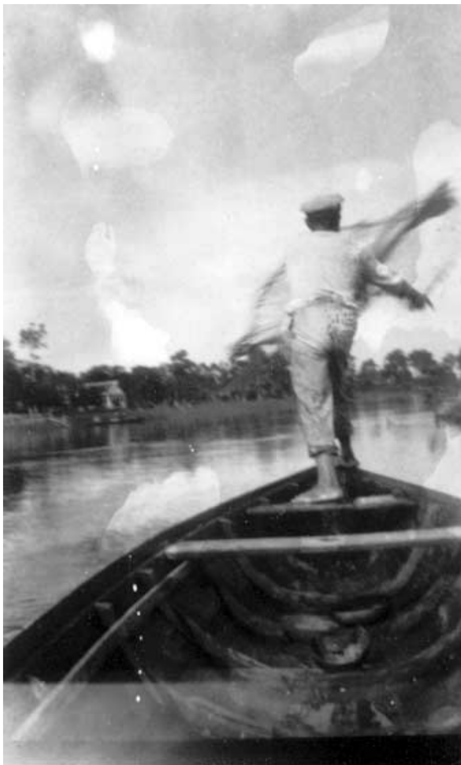
Figura 32 – “Futurismo pingando 7-VI-27” (notação no verso).