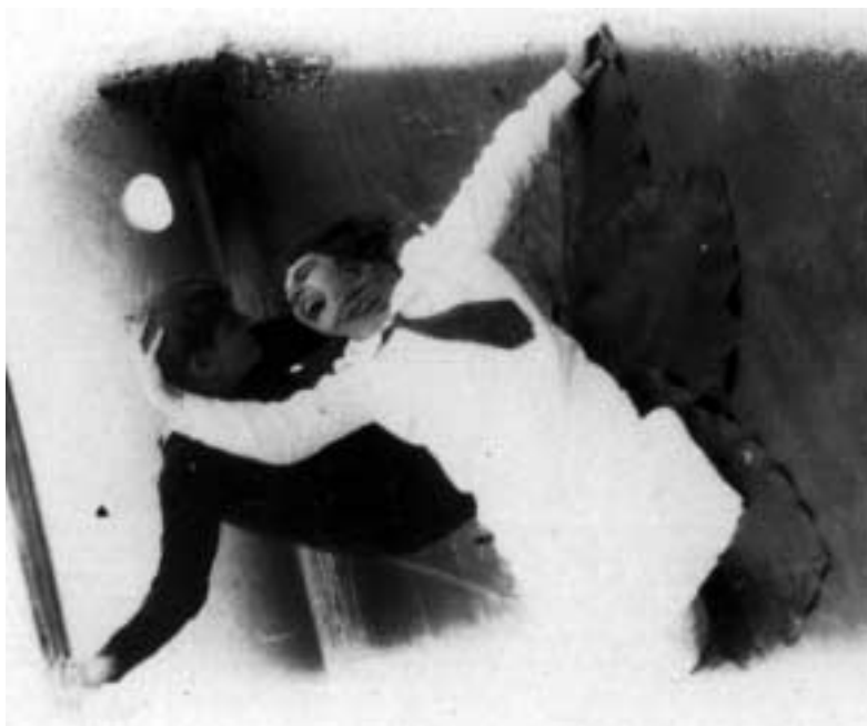
Figura 29 – "Amor e Psiquê no Solimões/ Junho – 1927/ Canova 1927" (notação no verso).