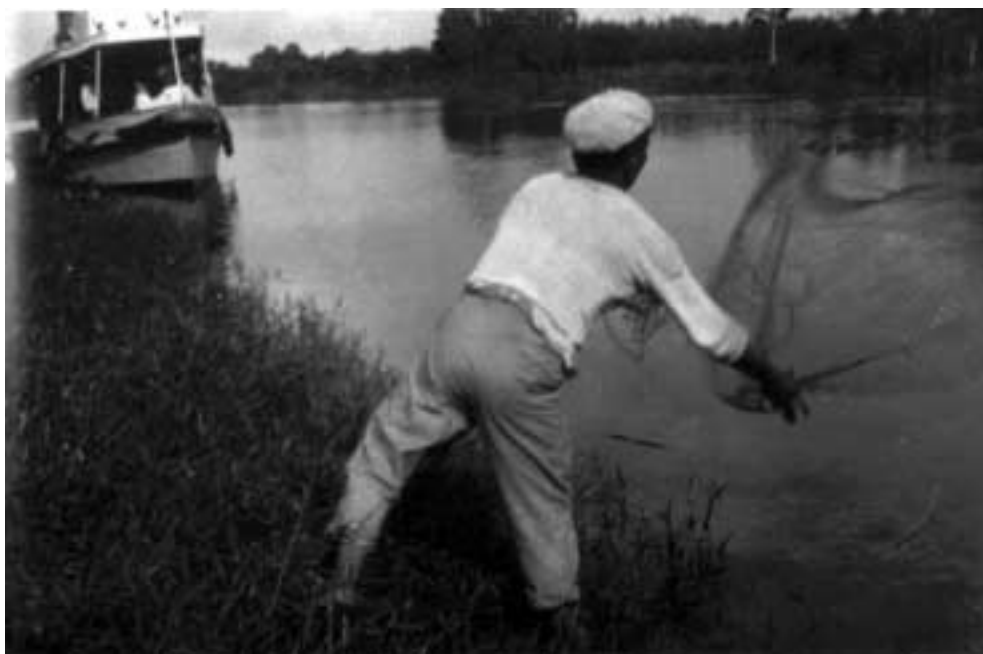
Figura 36 – “Tarrafeando a beira-rio/ Furo de Barcarena/ 7-VI-27” (notação no verso).