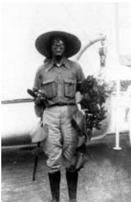
Figura 14 – “Assacaio/ (na mão direita uma flor feito cachimbo. Um grupo de flores bicos-de-araras na outra/ 17-VI-27” (notação no verso).