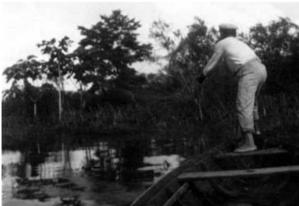
Figura 35 – “Tarrafeando/ Furo de Barcarena/ 7-VI-27” (notação no verso).