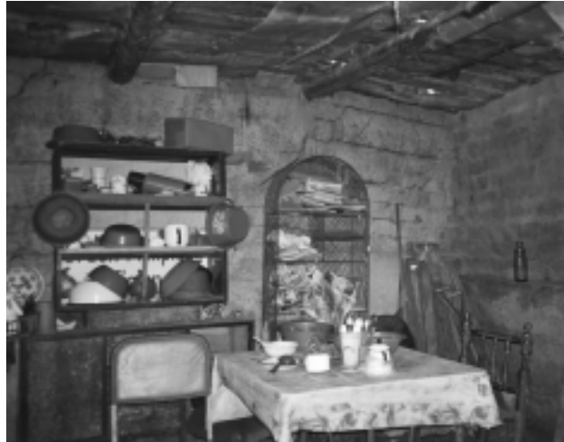
FOTOGRAFIA N°1. INTERIOR DE UNA VIVIENDA A.H. 7 DE OCTUBRE

Respecto al déficit habitacional no existe una cifra de común aceptación, por la poca o nula importancia que se le ha venido dando al estudio del tema habitacional en nuestro país. El mayor esfuerzo ha sido elaborado por el INEI ▶ 20 a través de los Censos