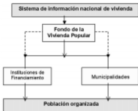
ESQUEMA N° 01: Elementos Centrales del Sistema

organizaciones sociales deberán tener un papel activo en la priorización de los programas a implementarse en los planes de acción local. También se contempla un sub-sistema de comunicaciones y de desarrollo de capacidades.