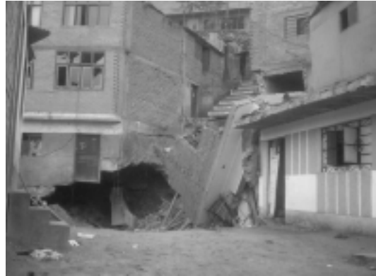
FOTOGRAFÍA N°3 A.H. 9 DE OCTUBRE