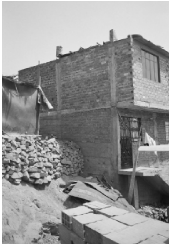
FOTOGRAFÍA N°2 A.H. 8 DE FEBRERO

La asistencia técnica debe cubrir dos campos complementarios: