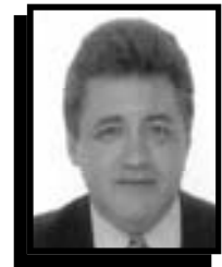
Por Edgar Enrique Zapata Guerrero

This diagnostic analysis has had fundamentals such as strategic orientation, knowledge management, logistic and production management, human resource, marketing and exportations, environmental management, communication and information management and financial management.