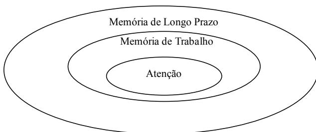
Figura 1. Concepção dinâmica das interrelações entre os processos atencionais, de memória de trabalho e de memória associativa de longo-prazo (modificada a partir de Cowan, 1988)

Como operacionalizar estes construtos derivados das teorizações dinâmicas de modo a possibilitar a sua