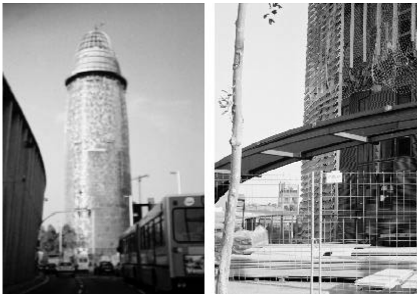
Figura 3. Izquierda: vista del general de la Torre Agbar de Jean Nouvel. Derecha: un detalle constructivo de cómo han montado la fachada de cristal de la Torre de Aigües de Barcelona.

En su momento, la alcaldía de Barcelona presentaba este edificio en carteles que decían "Barcelona atrevida". Hoy comúnmente se le conoce como el "falo" o "el supositorio", lejos de su referencia inicial con las montañas de Montserrat o las torres de la Sagrada Familia, conceptos formales con los que argumentaba el arquitecto francés la forma de la torre, pero más cercana quizás a la publicidad que de él hacía el propio Ayuntamiento de Barcelona.