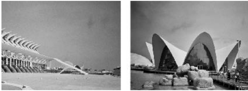
Figura 1. Izquierda: vista exterior del Museo de las Artes y las Ciencias de Valencia. Derecha: vista del Restaurante Subacuático de Valencia. Arquitecto Santiago Calatrava.