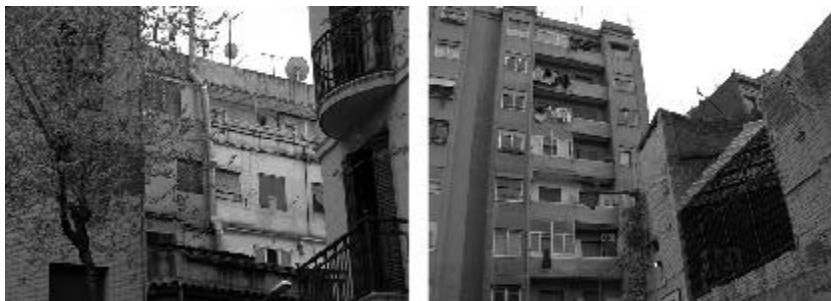
Figura 5. Vistas del barrio de Sants-Montjuic en Barcelona, con hacinamiento y mala calidad en la construcción, además de tener calles llenas de pintas, con hacinamiento vehicular. 'Otra' realidad que cohabita con la Barcelona del Fórum y de Gaudí.