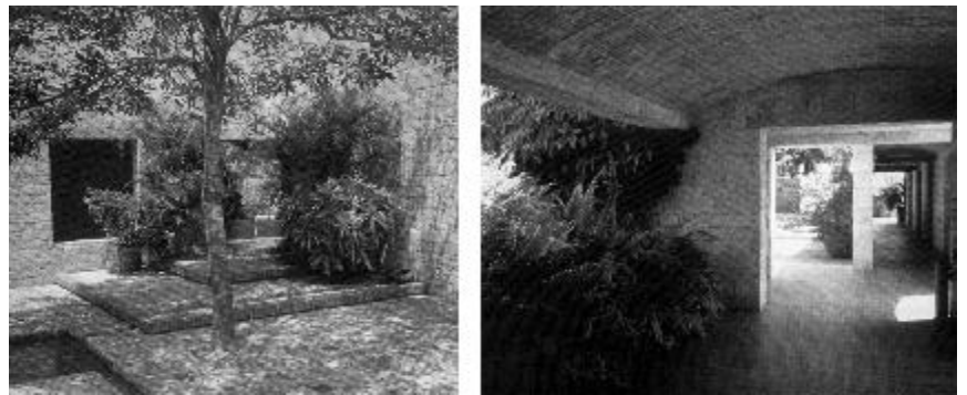
Figura 6. Vistas de los patios de la Casa de Huéspedes Ilustres. Arq. Rogelio Salmons, 1981.

Las preguntas son muchas y las dudas sobre esta eficacia son razonables, vistas las diferencias abismales entre la arquitectura de autor minoritaria, y una arquitecturización que los pobladores pobres ejercen a mansalva, intentando resolver sus proble-