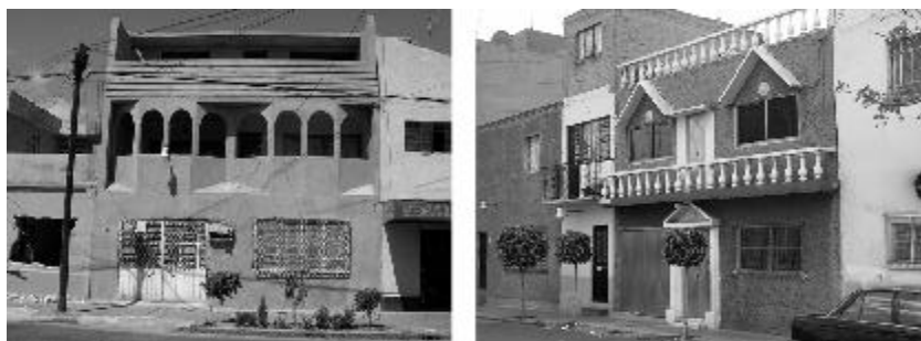
Figura 4. La gente pobre intenta sin recursos y sin arquitectos, construir obras que se parezcan en algo a las fotos de las revistas de moda. Por eso el mundo en desarrollo está lleno de ejemplos 'posmodernos-renacentistas' que tienden más al kitch que al diseño arquitectónico, pero que de una u otra manera involucra a sus autoconstructores' en este mundo de la imagen de 'lo bien'.