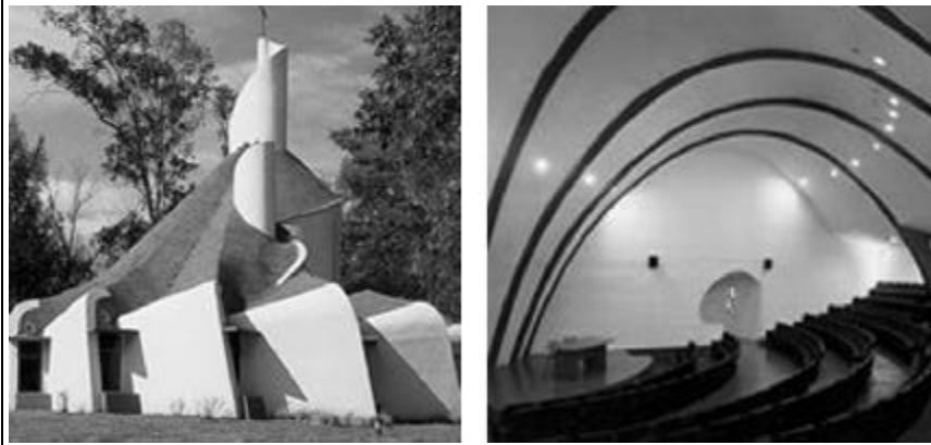
Figura 9. Casa de Retiro Espiritual en Maschwitz-Buenos Aires, 1999-2002.