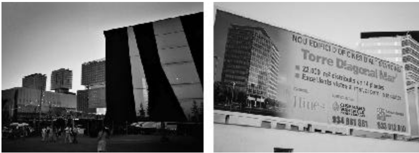
Figura 2. Izquierda: vista del Fórum de las Culturas de Barcelona 2004. Derecha: cartel de los Nuevos Edificios de Alto Standing que promueven las promotoras y el Ayuntamiento de Barcelona para el Sector Terciario que envuelve al Fórum.

Fuente: Figura del autor, Barcelona, 2004.