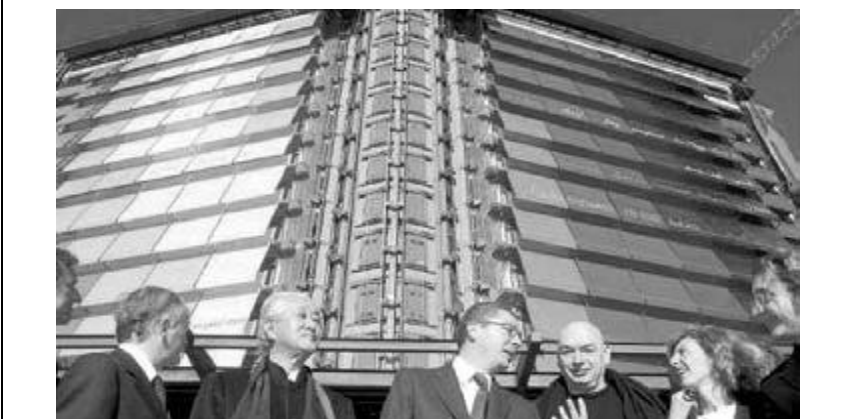
Figura 11. El alcalde de Madrid, Alberto Ruiz Gallardón, posa con el equipo internacional de 18 arquitectos y diseñadores en el proyecto hotel Puerta de América de Madrid, con una inversión estimada de 75 millones de euros.