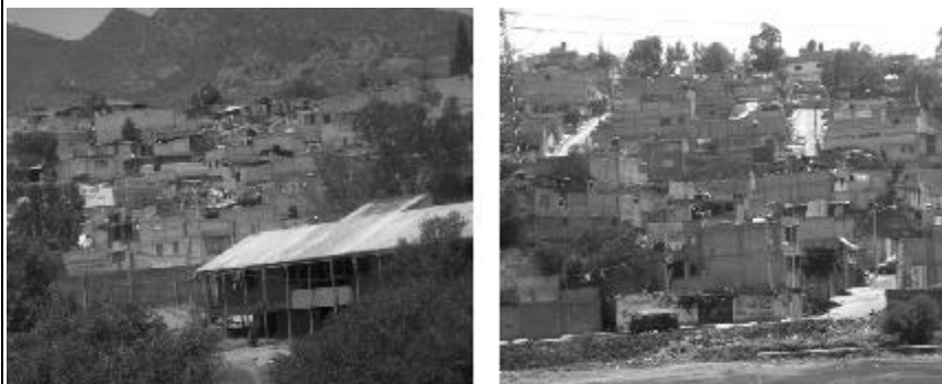
Figura 10. Dos vistas de las inmediaciones de la Ciudad de México y la inmensa cantidad de casas en autoconstrucción. La urbe cosmopolita se esfuerza por decrecer y encontrar un punto de equilibrio entre lo que 'nos dicen' que es la arquitectura, y la imagen urbana resultante de la necesidad de 'pertenencia y arraigo' de la población. La 'metodología de la pasarela' queda radicalmente desfasada de la realidad del mundo de hoy.