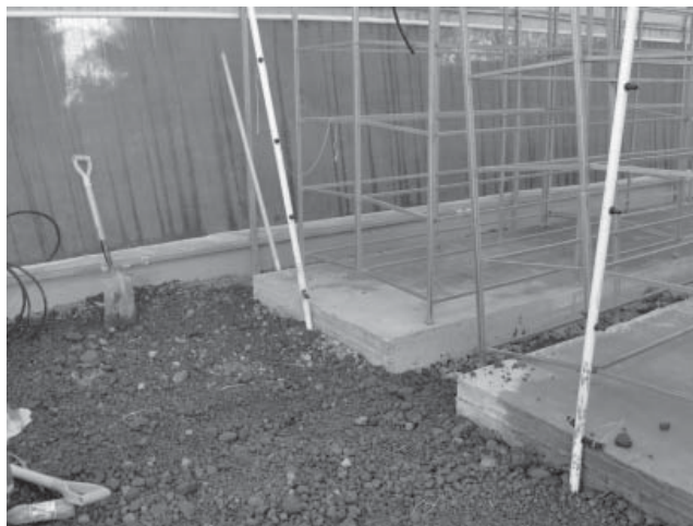
Figura 1. Dimensiones de los módulos para la colocación de las charolas de producción de forraje

En su interior se colocaron estructuras metálicas con PTRs de una pulgada, soldadas en forma de prisma rectangular con 2,40 m de largo x 1,20 m de ancho y 1,70 m de alto, conformada por 5 niveles separados a 45 cm cada uno de ellos (figura 1).