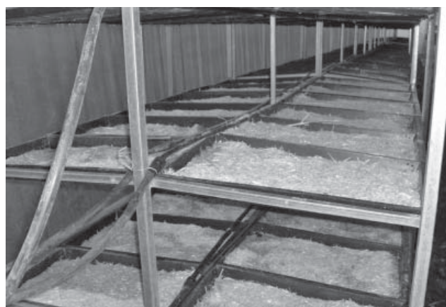
Figura 4. Colocación del sistema de riego por goteo a lo largo de los módulos de producción de FVH y la distribución de la humedad generada a lo largo y ancho de las charolas de germinación.

Para evitar problemas de falta de uniformidad en la distribución del agua en la charola se utilizó paja de trigo molida, en una mezcla de paja/grano de 200 g de paja por 600 g de grano de cebada, dicha mezcla se distribuyó a lo largo y ancho de la charola, éstas tenían una inclinación de 1,0 cm (1,5% de pendiente) lo que garantizó un escurrimiento adecuado favorecien-