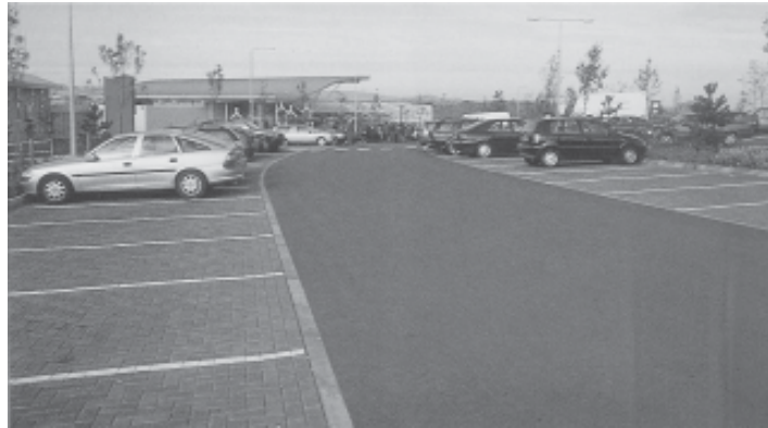
Figura 1. Aparcamientos de pavimento permeable de adoquines (SEPA, 2001).

En cualquier caso todas las capas del firme deben tener permeabilidades crecientes, desde la superficie hasta la sub-base, incluyendo geotex-