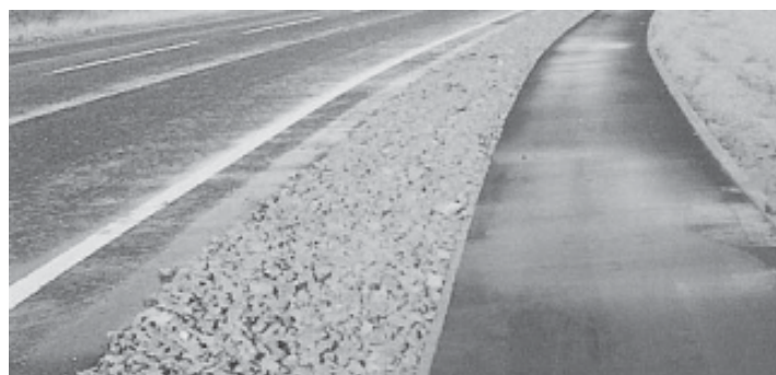
Figura 4. Dren filtrante (SEPA, 2001).