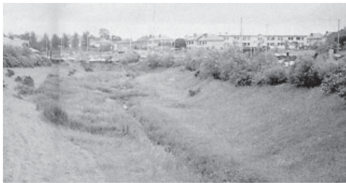
Figura 6. Zona de detención. Los laterales pueden servir de ejemplo de franjas filtrantes (SEPA, 2001).

Las pendientes laterales deben ser tendidas por seguridad para permitir la salida en caso de caída al agua, así como el acceso y mantenimien-