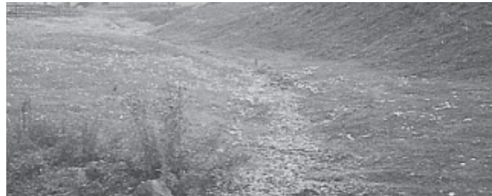
Figura 2. Zanja de infiltración (SEPA, 2001).

tiles, con la intención de que el agua fluya y no se quede retenida en su interior. La misión de los geotextiles en este tipo de pavimentos es primordial actuando como filtro, separación o como refuerzo estructural (Pratt, 2003).