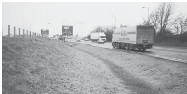
Figura 5. Cuneta verde (SEPA, 2001).

del geotextil. De este modo, en algunos drenes no es necesario dirigir el agua hasta el punto de vertido, pues al cabo de una cierta longitud se ha infiltrado totalmente.