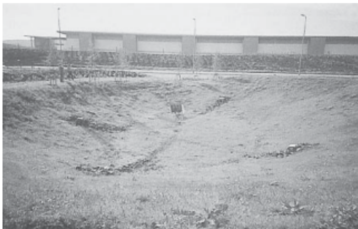
Figura 3. Depósito de infiltración (SEPA, 2001).

El tiempo de estancia del agua en el dren debe ser suficientemente alto y la velocidad del agua suficientemente lenta para que exista infiltración a través